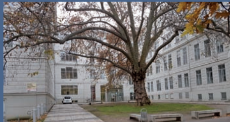
Akademie mit Haupteingang