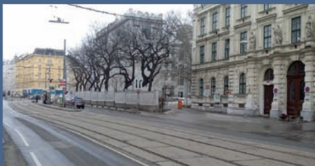
Eingang Spitalgasse 23

Interdisziplinäre Fachtagung für alle, die in unterschiedlichen Kontexten therapeutisch, beratend oder betreuend tätig sind